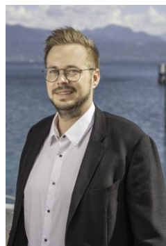
Alexandre Spring ISS